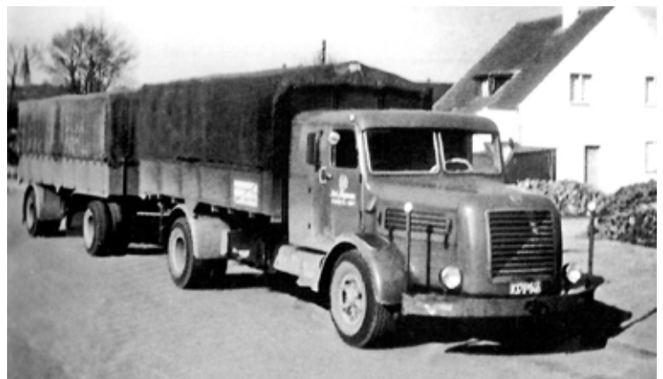
Faun F 68 mit luftgekühltem Deutz-Diesel und verlängertem Fahrerhaus Mitte der fünfziger Jahre