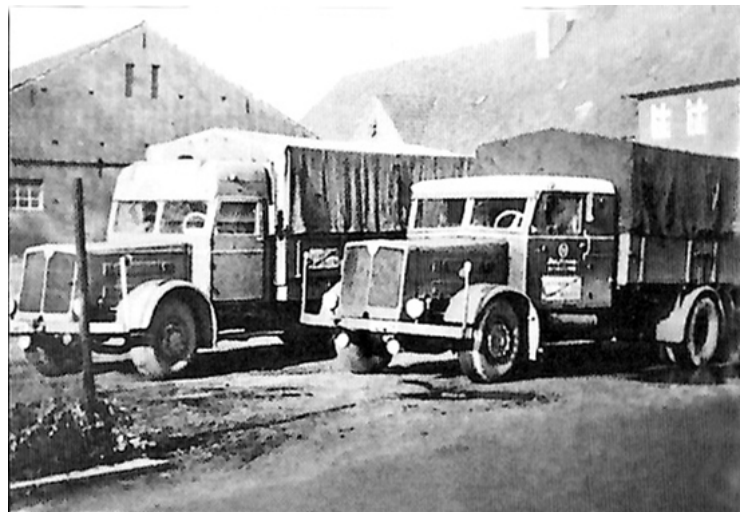
Der Faun L 7 mit wassergekühltem Sechszylinder-Deutz-Diesel markiert den Wiederbeginn des Fernverkehrsbetriebes in der Nachkriegszeit. Rechts der Hegmann-Wagen mit verlängertem Fahrerhaus, links ebenfalls Hegmann, aber Verwandtschaft

Neuanfang des Speditions geschäfts. Vorwiegend werden Baumaterialien für Sonsbecker Bürger gefahren. Wenn keine Transportaufträge vorliegen, wird die Arbeitskraft in den Wiederaufbau des zerstörten Firmensitzes investiert. Noch sind Familie und Unternehmen notdürftig im Haus Heekeren in Stadtveen untergebracht. Es ist die Zeit des Tauschhandels. Kohle wird gegen Baumaterialien getauscht