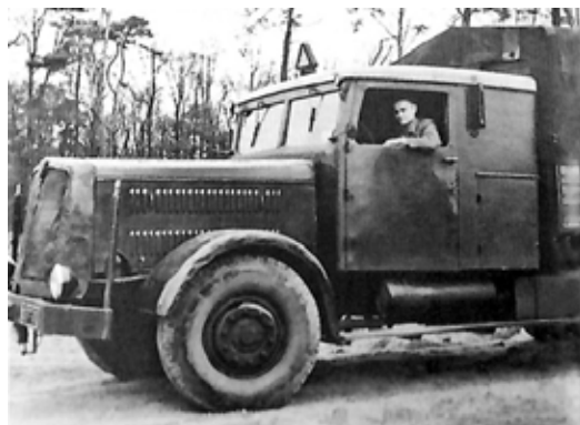
Das lange Fahrerhaus des Faun L 7 mit zusätzlicher Stauraumklappe

Der Rhein als natürliche Grenze zwischen Europa und dessen Übergänge werden in den letzten Kriegsmonaten zu einem erbittert umkämpften Gebiet. So werden auch das Wohnhaus und die Nebengebäude von Hegmann während der Kampfhandlungen völlig